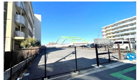
都から取得した西尾久3丁目の用地と隣の駐車場エリアの土地も借りて整備へ

建設費高騰、福祉分野の人材不足など課題が多々ありますが、スケジュール通りに設置、運営できるよう区のサポートが求められます。ご意見をお寄せください。