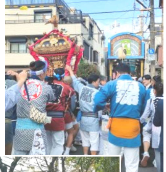
↑お神輿も登場！ お疲れさまでした

8日(日)、都電荒川線「荒川一中前」停留所の25周年を記念し、商店街や町会が主体となって記念式典を開催。わたしも参加してきました。六瑞小のマーチングバンドや第一中のブラスバンドが演奏、記念ヘッドマークのついた車両が運行し、たくさんの方が25周年をお祝いしました。