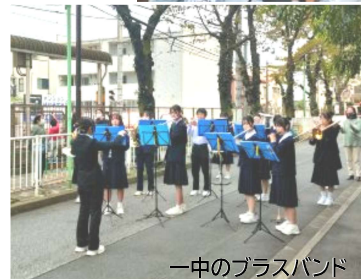
一中のブラスバンド

「一中前」は、地元振興のため住民が1999年に都議会へ請願を提出、趣旨採択され、2000年に完成。住民のみなさんが主体となって造られたということで、本当にすごいと思います。都電や商店街、お祭りなど昔ながらの風景も大切に、これからも地域の活性化に協力したい。