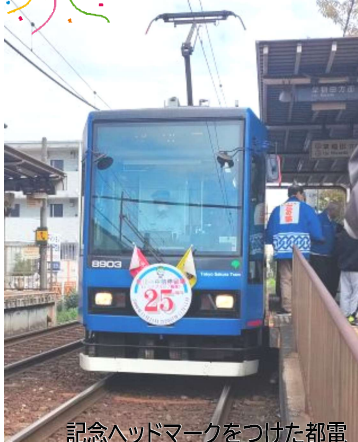
記念ヘッドマークをつけた都電

8日(日)、都電荒川線「荒川一中前」停留所の25周年を記念し、商店街や町会が主体となって記念式典を開催。わたしも参加してきました。六瑞小のマーチングバンドや第一中のブラスバンドが演奏、記念ヘッドマークのついた車両が運行し、たくさんの方が25周年をお祝いしました。