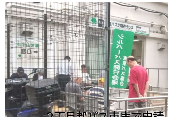
2丁目都バス車庫で申請