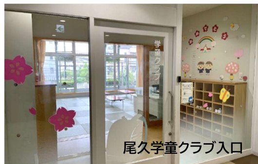
尾久学童クラブ入口

い現状です。コストカット優先の民間委託や指定管理者制度を見直し、職員の研修や処遇改善を区の責任で行ってほしい。区営学童が積み重ねてきた学童の年間行事や保育指針の実践を全体に広げ、よりよい学童保育を求めていきます。