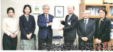
共産党区議団の予算要望書提出

日本共産党区議団は、新年度の予算編成にあたり、昨年11月に区長に対して区民の暮らし・営業を守る支援策として「介護保険料の値下げ・据え置き」「物価高騰への暮らし支援」「学童クラブの民営化見直し」「さくらバスなど地域公共交通に補助と支援を」など552項目の予算要望書を提出しています。