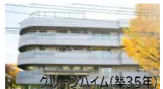
グリーンハイム(築35年)