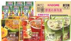
野菜を使った市販の保存食

非常時でも命、健康維持 また、備蓄倉庫のスペースの課題もあり、内容や味は向上していますが、アルファ化米や乾パンなどが中心です。避難所の食生活で栄養不足や便秘になることも多く、関連死を防ぎ、