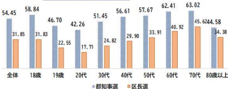
都知事選と区長選の投票率

前回の投票率はこんな感じで、区長選は31.85%の低投票率に。みんなが投票に行こうと思えるような、希望ある区政への転換を提案したい。