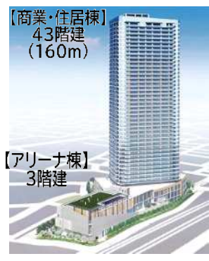
【商業・住居棟】 43階建 (160m)