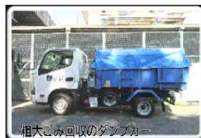
粗大ごみ回収のダンプカー

荒川区では、粗大ごみ回収後に「金属」と「それ以外」に分け、「金属」は処理施設で資源化、「それ以外」のごみを江東の中間処理施設へ運んでいます。自治体によっては分別せずに全て江東の施設に運んでいる場合もあるそう。火災防止に、23区全体が荒川区のようにまず分別・資源化しては、と思います。また、区の粗大ごみ回収には圧縮機ではなくダンプカーを使用して運ぶなど、火災への配慮を行っています。