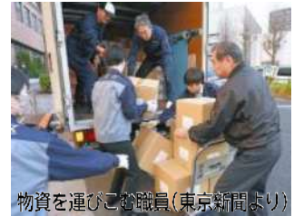
物資を運びこむ職員

都は救助隊の派遣、都営住宅100戸の提供などを開始。交流都市などへの支援も開始、文京区は能登町から要請を受け、非常食4,500食、500ml飲料水3,000本、毛布、乳児用ミルク、生理用品等の支援物資を、5日にトラックで輸送。稲城、武蔵野、昭島の各市も飲料水を送付。