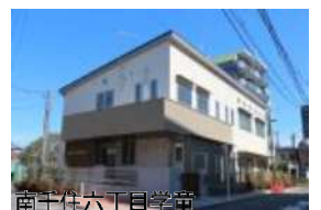
南千住六丁目学童

さらに一歩すすめ、学校調理室を活用したできたての昼食を提供できないか、要望しています。先進自治体の例を参考に、希望する保護者や子どもにどう応えるか、子どもの貧困対策としても荒川区でも検討したい。