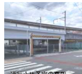
通行止め予定の高架

10/8付のレポートで、都市計画道路補助331号線の整備工事にともなって駅南側のアンダーパスが通行止めになる、とお知らせしました。