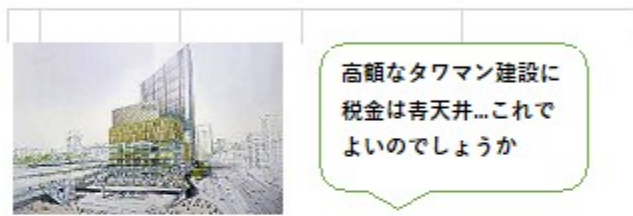
西日暮里駅前地区再開発の事業費と財源内訳

ビルの建設、保留床の処分を行うデベロッパー「土地や街の開発大手事業者」は、この再開発で商業床が売れなくても責任なし。建てて売って、大きな利益をあげます。