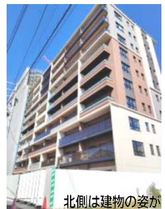
北側は建物の姿が

総戸数181、2LDK～3LDK以上のファミリータイプで、入居は来年4月を予定。保育園や小学校など児童増への区への対応も求められます。学区は瑞光ですが今でも子どもはいっぱい。