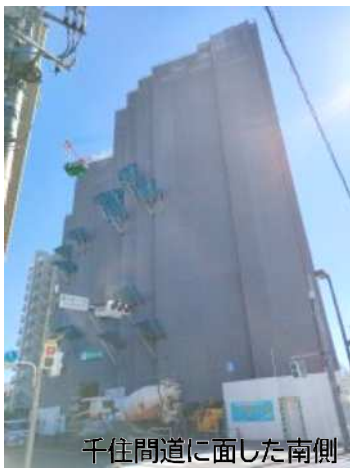
千住間道に面した南側

南千住1丁目バーミヤン跡で建設中の「ライオンズグランプレイス」。千住間道に面した南側はまだまだ建設中ですが、北側は囲いが外れ、段々と出来上がってきています。