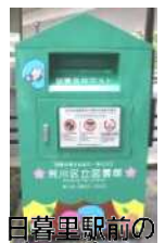
自営里駅前ブックポスト

休館中も貸出できる？ 休館中の予約図書・資料については、スポーツセンターでの受取・返却の実施を検討していますが、ふれあい館でも可能にする、駅前に返却ポスト（ブックポスト）の設置も求めたい。みなさんの声もお寄せ下さい。