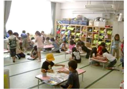
九峡小学童クラブ室

区は現在も調査を進めており、結果に基づき、事業者に対する処分及び今後の対応に検討するとしています。事業団が運営している峡田学童クラブ、尾久小総合プラン、六瑞小にこにこすくーるでは保護者向けの説明会を実施しました。欠席した方にも質疑内容が分かるよう、議事録を公開するなどの配慮を求めました。