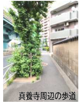
真養寺周辺の歩道

よく見ると植栽の根本は土ではなく埋められているよう（写真右）ですが、段差が残っています。さらに草が茂って見えづらくなっているため、国道の管理事務所に連絡しました。対応待ちとなっています。この付近では歩行者と自転車の事故もあったようで、対応が急がれます。