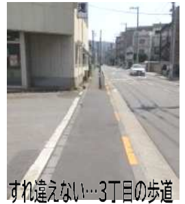
すれ違えない…3丁目の歩道

「南千住3丁目、隅田川駅の南側の道の歩道が狭すぎます。人がひとり通るのがやっとですが、広げられないでしょうか」とご意見が…区の道路課に確認しましたが、現在は拡張の予定はないとのこと。貨物の大型トラックの通行も多いため車道側に広げるのは難しいそうですが、隅田川駅東側の道と明治通りをつなぐ「補助321号線」が完成すれば交通の流れも変わるため、拡張の可能性も。補助321号線は東京ガス敷地を通過し、汚染土壌対策の協議に手間取っていて、事業化がすすんでいない状況です。どのような安全対策ができるか考えたい。