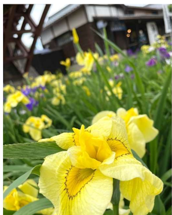
潮来市のあやめまつり(花菖蒲)

6月15日に行われた観光・文化推進調査特別委員会で国内都市交流の状況について報告がありました。