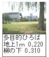
多目的ひろば 地上1m 0.220 柳の下 0.310

34か所で測定した結果、基準以上の96施設152か所で、洗浄や土の入替えなどの対策実施。南千住地域では35施設158か所測定し、41か所で洗浄等を実施。区は「指標の範囲内となっており、健康に影響を及ぼすレベルではない」としていましたが、共産党区議団は独自で測定を継続しました。