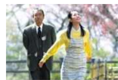
博士の愛した数式

それぞれ 10:00/13:30の2回、各回80名。 ゆいの森あらかわ1階総合カウンターで直接申し込みか、ホームページからも申し込み可能です。 「さかなのこ」はジョイフル三の輪もロケ地に。 ぜひご覧ください。