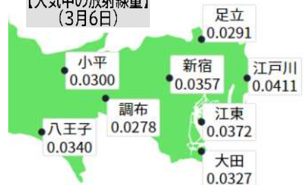
【大気中の放射線量】 (3月6日)

区議団として放射能測定も 荒川区は、独自の放射能測定を2011年11月まで行わず、23区最後に。学校や保育、公園など区内195施設8