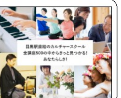
目黒駅直結のカルチャースクール 全講座500の中からきっと見つかる! あなたらしさ!