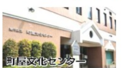
町屋文化センター