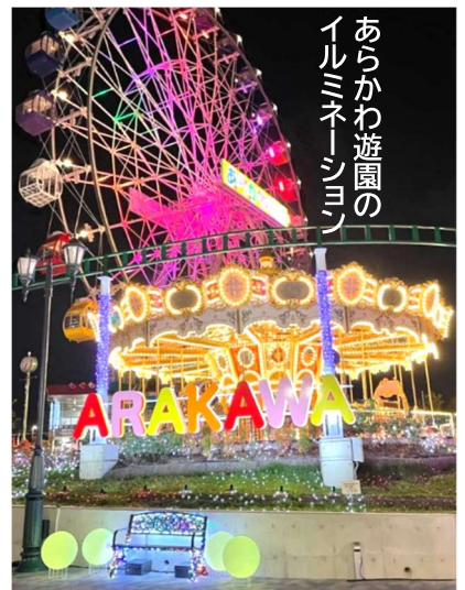
あらかわ遊園のイルミネーション