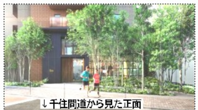
↓千住間道から見た正面