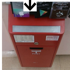
コンビニ内のポスト

東尾久ひろば館前に設置してあった郵便ポストがひろば館閉鎖とともになくなりました。以前は本町通りの城北信金そばにあったものが継続設置ができなくなるため、区としてもひろば館の敷地に移転を要望してきた経過もありました。今回、本町通りふれあ館設置でひろば館の廃止、その後東京都に売却(消防署の拡張)なることから、その後の移転先も提案してきました。今回、本町通りの「ローソン」の店内にポストが設置されていることから廃止したという事でした。