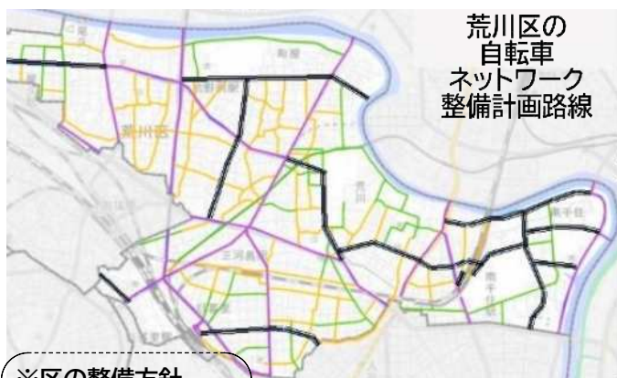
荒川区の 自転車 ネットワーク 整備計画路線

現在のドナウ通りは、歩道内に自転車通行帯があって歩行者と接触する場合もあり、専用レーンの整備には、街路樹や植栽含め車道の形状をどうするかが課題です。