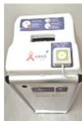
↑ おむつ回収ボックス

でのおむつ回収は保管方法や回収後のごみ処理などの課題があり、なかなか進んでいませんでしたが、今回は施設のリニューアルにともない新たに設置されました。ボックスはリースで、費用は年間90万円（月7.5万円）です。