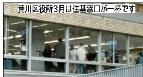
荒川区役所3月は住基窓口一杯です

普段の生活や仕事の中で「なぜか自分だけいつもうまくいかない…仕事が続かない…コミュニケーションがとれない」本人も家族も悩んでいる方が増えました。