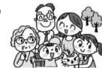
あらかわ遊園使用料