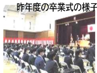
昨年度の卒業式の様子

3月、春めいてきて卒園・卒業式がもう目の前です。17日(木)区立幼稚園終了式、18日(金)区立中学校・24日(木)区立小学校の卒業式の予定です。しかし、都の「まん延防止」期間が3月6日(日)に延長、さらに13日まで延期が検討されており、子どもたちの最後の思い出作りもままなりません。