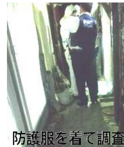
防護服を着て調査

ひとり暮らしの高齢者の方のお宅で、「ポストの郵便物が溜まっているので心配」と父に電話を頂き、さっそく出かけてみたようです。