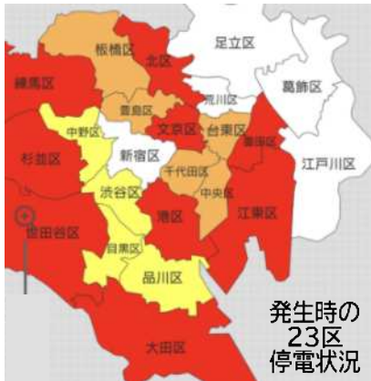
発生時の 23区 停電状況

この地震で、東京電力管内で約210万戸の大規模な停電が発生し、都内18区（荒川区など5区を除く）など約70万戸に影響がでました。