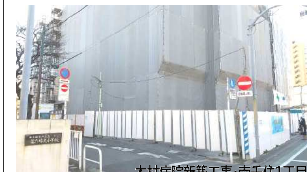
木村病院新築工事・南千住1丁目