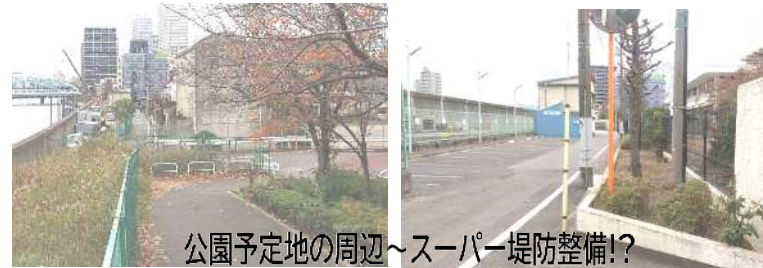
公園予定地の周辺～スーパー堤防整備!?

旧浄水場跡地(南千住6丁目)1.8%の公園整備とともに周辺のスーパー堤防整備も検討されています。川沿いの用地は所有地だけでなく、民間用地の協力が不可欠です。最近、民間駐車場の車両が撤去され可能性も高くなっているようです。公園整備の前提条件が変わってくるかもしれません。