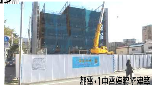
都電・1中電停留所にて建築

南千住一丁目の一中都電停留所わきで木村病院(現・町屋)の移転・新築工事が進んでいます。来年5～6月開設に向けて、5階建ての躯体が立ち上がってきました。一方、年内で女子医大東医療センターは足立区へ移転に。