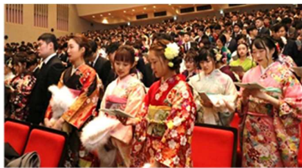
2020年1月の成人の日のつどい

来年1月の成人式は、現在の予定では1月10日(月曜)にサンパール大ホールで開催を予定しています。出身中学校別に分かれての三部制となり、例年90分の式典を30分に大幅短縮します。参加は事前申込制で、案内はがきのQRコードから電子申請が必要です。