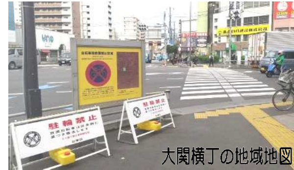
大関横丁の地域地図

地下鉄三ノ輪駅から降りてきた方…周囲をきょろきょろしてスマートフォンを見ながら歩き出しますが、また戻ってきて、道を尋ねる姿をよく見かけます。