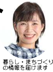
暮らし・まちづくりの情報を届けます

jcp-arakawakugidan.jp/ Twitter @m1010_yuko araken-nan.jugem.jp