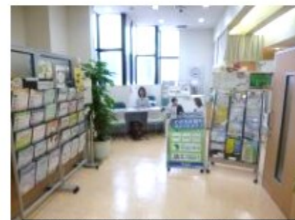
文章と写真は区のホームページより

※注釈 本相談は本人の意思に基づいた就労の支援を行うもので、医療的な相談やケア等には対応していません。