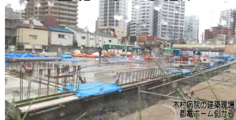
木村病院の建築現場 都電ホーム側から

ご意見・ご質問頂きました。○「6丁目ライフそばのお寿司屋さんの隣の空き家で異変があったようです。もしご存じでしたら教えてください。」とメール頂きました。確かに空き家になっていた建物に8月の暑い時期、高齢者の方が何らかの理由で家屋に入り亡くなっていたようです。熱中症だったのでしょうか?警察は事件性はないと判断したようです。一番の被害者はお寿司屋さんでした。○先週は雨が続き駅頭のレポート配布は中止。二人目の娘ももうすぐ一才です。そろそろ朝の配布に私も参加準備中です。