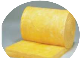
ロール状のグラスウール

断熱材「グラスウール」は、綿あめと同じ原理で、高温で溶かしたガラスを綿状に細かく繊維化したものです。厚さ2.5cm・1畳位の大きさで重さは約2kgですから、万が一、人にあたっても怪我はないそう。また、外側にも断熱材が設置されているため、断熱効果にも問題はないとのこと。