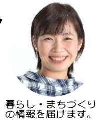
暮らし・まちづくりの情報を届けます。

jcp-arakawakugidan.jp/ ツイッター @m1010_yuko araken-nan.jugem.jp