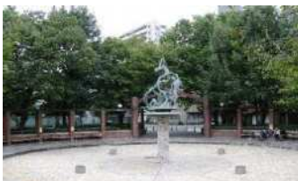
↑ 日暮里南公園噴水広場

「都立公園も実施予定」とのこと(期間は不明)。しかし、21日(月)に解除された緊急事態宣言が再び出されると、中止の可能性も…。オリパラ観戦押しつけより、感染対策に気を付けながら、暑い夏の子どもの生活をみんなで見守りたい。