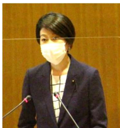
子どもに係る内容にしばって質問しました

「子育て世帯生活支援特別給付金事業」、「新型コロナウイルス感染症生活困窮者自立支援金支給事業」を含む一般会計補正予算など可決されました。また、オリパラ中止を求める意見書を議会ですすよう求める陳情は、付託された委員会では日本共産党のみ採択を主張。自民、公明など他党派の多くが不採択、一部が趣旨採択を主張し、不採択となりました。残念です。