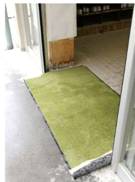
段差が改善されました

荒川区では選挙投票日当日、棄権防止の防災行政無線(屋外スピーカー)での発信をしていません。選挙管理委員会は、騒音の苦情がくるため屋外スピーカーの活用はせず、選挙のお知らせはメールマガジンや小型車でPRしているとのこと。葛飾区では「投票日です」のアナウンスに加えて、その時点の投票率も発信しているようです。投票率を伸ばす方を改めて検討すべきではないでしょうか。