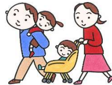
2 認可保育園入園状況・待機児童数等の推移 (各年4月1日現在)

子ども家庭部保育課入園相談係 電話番号: 03-3802-3111 (内線: 3825)