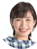
暮らし・まちづくりの情報を届けます。

jcp-arakawakugidan.jp/ Twitter @m1010_yuko araken-nan.jugem.jp