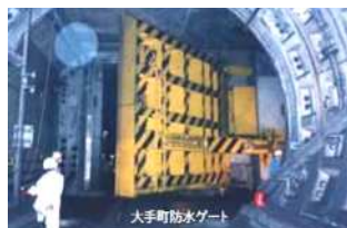
大手町防水ゲート

日比谷線〈三ノ輪坑口〉以外でも銀座線〈上野通路線〉・半蔵門線〈押上坑口〉に2027年度までに設置が予定されています。