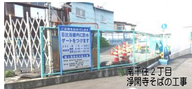
南千住2丁目 浄閑寺そばの工事

駅の入口の7割で、高さ35cm×2枚の止水版を設置し、浸水を防止する工事が進んでいます。