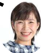
暮らし・まちづくりの情報を届けます。

.jcp-arakawakugidan.jp/ ツイッター @m1010_yuko araken-nan.jugem.jp