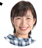
暮らし・まちづくりの情報を届けます。

ツイッター @m1010_yuko そうけん南千住ブログ araken-nan.jugem.jp