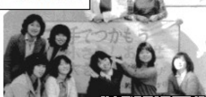
新入生歓迎会の時