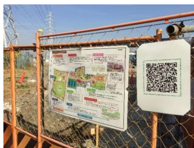
工事中の宮前公園と新尾久図書館

☆宮前公園の工事が進んでいるけれど、どんなものが出来上がるか分かるようにしてほしいとのご意見をいただきました。区に要望したところ、工事現場の柵に完成予定図が掲示されました。また、スマホで確認できるようにQRコードも付いています。公園内の新尾久図書館の工事はほぼ終わり、館内では図書の陳列作業をしていました。新図書館の来年2月オープンも待ち遠しいですね。