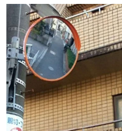
カーブミラーを設置

☆西尾久6丁目に選挙公営ポスター掲示板がなかった！とご指摘をいただきました。以前は小台橋保育園脇に掲示板がありましたが、工事のため東尾久に移転したとのこと。現在は保育園の工事が終わっているので、西尾久6丁目に掲示板を戻すよう要望しました。選挙管理委員会から次の選挙から改善したいとの回答がありました。