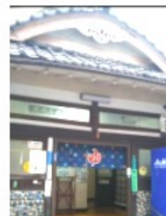
公衆浴場数の推移