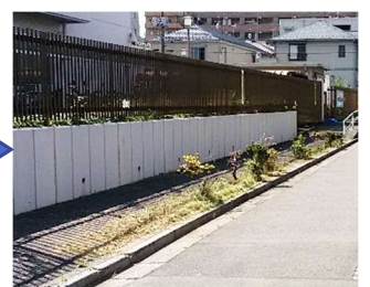
スッキリしました