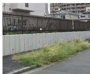
草が茂っていましたが...