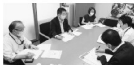
労働者から要請する日本共産党の小池晃書記局長(左から2人目)

日本共産党国会東京事務所と連絡もとり救済措置を求めていましたが、8月20日、日本共産党小池晃書記局長・参議院議員が要請を行いました。