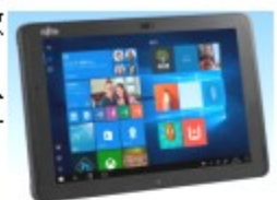
FUJITSU 10.1型ワイド防水タブレット ARROWS Tab Q508/SE (文教モデル)