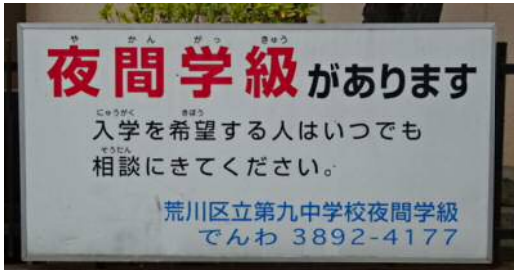
校門の横にある看板

戦後、さまざまな理由で昼間の学校に通えなくなった人たちのために、昭和32年(1957年)に荒川九中夜間学級は始まりました。 今では、戦争や病気、不登校など、さまざまな理由で小学校、中学校を卒業できなかった10代〜80代までの人、また、卒業していても入学できる場合もあります。いろいろな国の人が一緒に勉強をしています。 ちなみに、中学校夜間学級はここを含め、全国に3校(東京8)あります。