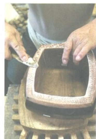
三味線の皮は細棒に猫皮、太棒には人皮を使う