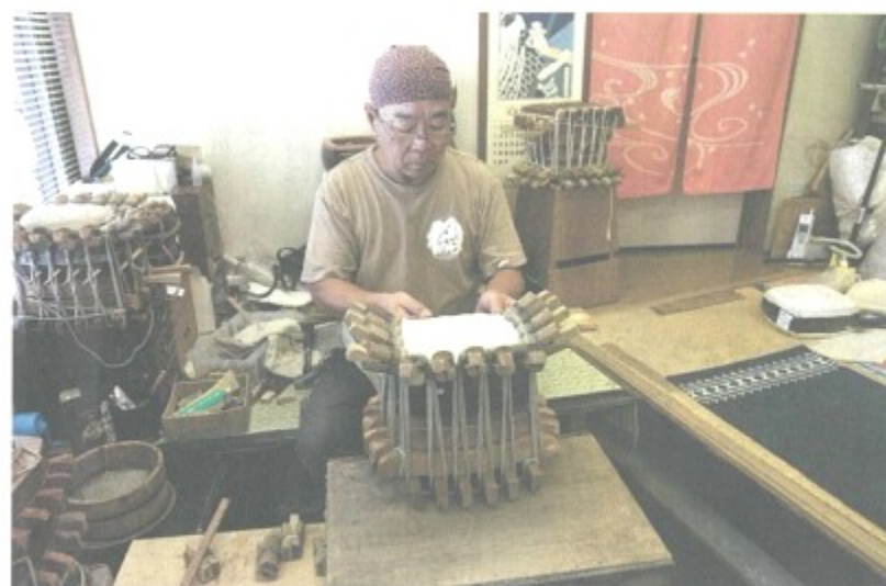
糊をつけた胴に皮を張る。張り具合はくさびで調整。乾燥したら最後に棒をつける