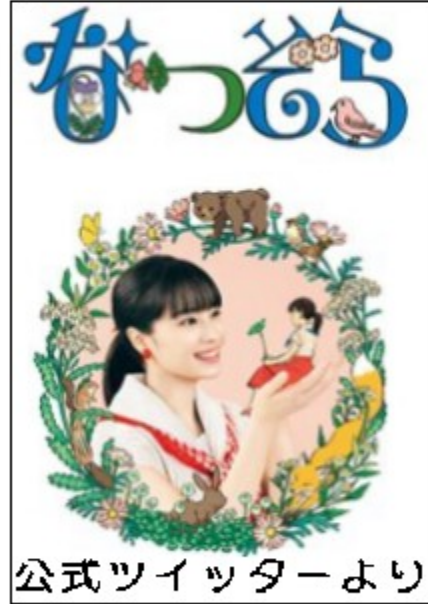
公式ツイッターより