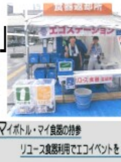
マイボトル・マイ食器の持参 リユース食器利用でエコイベントを!

2016年、フランスは使い捨てプラスチック食器を禁止する法律を制定しました。台湾、EUをはじめとして、脱使い捨てプラスチックの動きは世界の国々で加速化しています。日本は世界に大きく後れをとってしまっています。