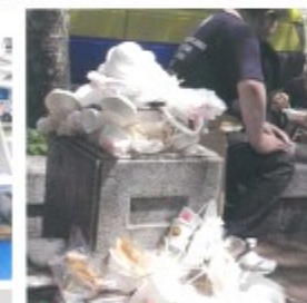
イベント時のごみの70%~80%は 使い捨てのプラスチック容器