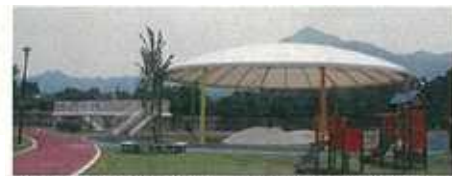
5びっこ広場:屋外テント・トランポリン状エア遊具イメージ

最初の計画からの主な変更点 しばふ広場はひな壇上にし、平らな広場面を確保する。また35mのロング滑り台、児童用複合遊具も設置し、休憩や食事スペースを十分確保。 鳥インフル対策で「どうぶつふれあい広場」のバードケージ撤去。豆汽車からの眺めを良くする。 ちびっこ売店、魚つり管理所、トイレが入る施設を2階建てに変更し室内遊び場を設置する。 ちびっこ広場に屋外テント、トランポリン状のエア遊具を設置 キャンディハウスの新築 スワンの池に水上デッキを設置、一球さん号を休憩、食事スペースとして活用する。 魚釣り広場の中央デッキ部分に車椅子用エリアと水深を浅くし子どもの安全を確保