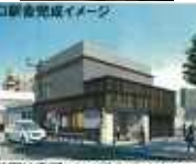
西口駅舎完成イメージ