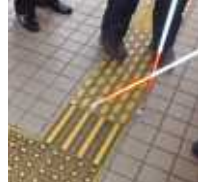
南側乗り換え通路の点字ブロックは以前の形状が混在。JIS規格のブロックに統一して設置を。