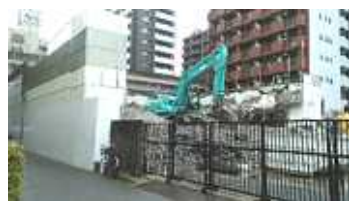
現在解体中。 ここに出来るビルの2階部分で開設

2018年3月1日現在 人口22,861人 10,650世帯 2018年度一般会計予算 145億6000万円 高校生まで医療費無料化 3,600万円(予算 の0.26%) 給食費無料5,700万円 (予算の0.39%)