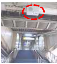
階段への誘導音声「鳥の声」が途切れることのないようにしてください。階段がわからず方向を見失い死亡事故につながることもある。