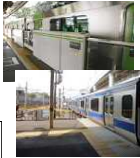
JRは山手線に設置されたホームドアが京浜東北線にはなし。