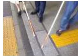
日暮里駅敷地から公道への点字ブロックが途切れている。管轄の違いを越え連動するように。