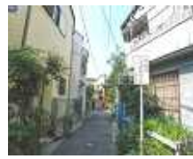
区内の住宅 密集地域

2月会議でも民泊はどこにあるかわからない。密集地域が多い荒川区の住民にとっては不安など各会派から意見が出されました。国の民泊新法が6月15日から施行となりますが年間180日まで営業を許可します。荒川区は年間115日しか営業を認めないなど国の規制緩和に歯止めをかける条例案が提案されます。また民泊への規制強化に伴って、宿泊日数に規制のない簡易宿所に流れる傾向があり、区内でも4カ所の簡易宿所の計画が予定されています。