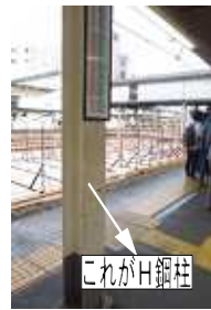
H字型柱にぶつかってケガをする。バーを付けて。

4月12日、東京都視覚障害者協会(東視協)と共産党区議団は、日暮里駅のJR・京成のホームドアや音声案内設置状況などの調査を行いました。