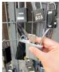
民泊の場所 あるカギの場所

閉会会議には、6月15日から施行される住宅宿泊事業法(民泊新法)について荒川区独自の民泊規制条例案が提出されます。